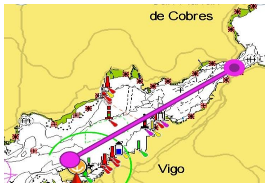
RECORRIDO Nº 2: Bouzas - Rande 5,3 NM